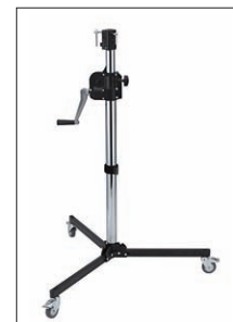
ローベースウィンドアップスタンド 2段 190cm