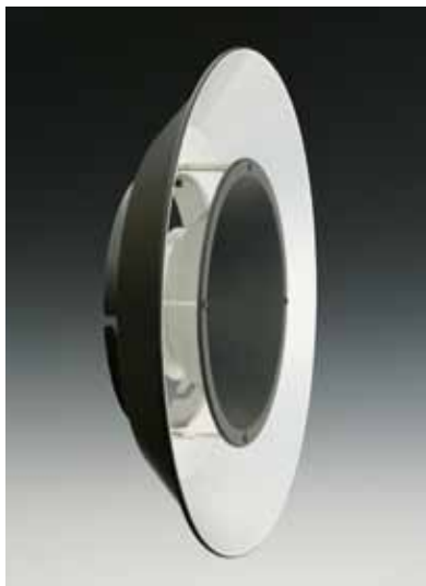
[121135] リングライトリフレクター (395φ) 税抜価格 40,000円