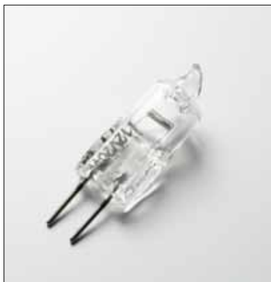
[123307] ハロゲンランプ 12V-20W リングライト 32用 税抜価格 1,800円

付属品：ハロゲンランプ 12V・20W 10灯・ガード・カメラ架台 税抜価格 294,000円