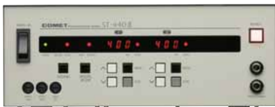
ST-440 II (400Ws×2)

*無線シンクロ用 AC コンセント搭載。わずらわしいコードから解放されます。 *不発光・ヒューズ切れを知らせる警報機能を内蔵。 *2タイプ × 出力モード × 出力バリエーターで、幅広い調光が可能。