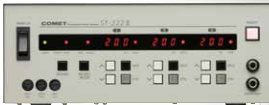
ST-222 II (200Ws×3)

[001046] ST-222 II 電源部 JANコード 4582278084327