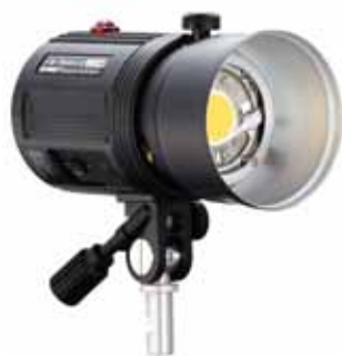
※リフレクター別売