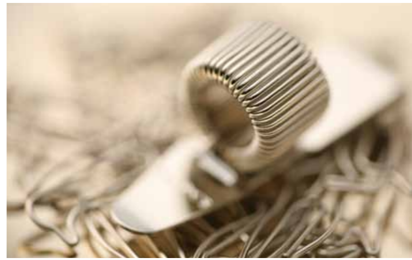
上の写真は、小さな被写体の一点にピントをあわせ、きれいなボケ味で大胆な奥行きを出した例。低光量が求められる開放値の撮影などで、表現力の幅が広がります。 光量出力:6Ws レンズ:f3.5 マクロ 180mm 開放値 f3.5で撮影