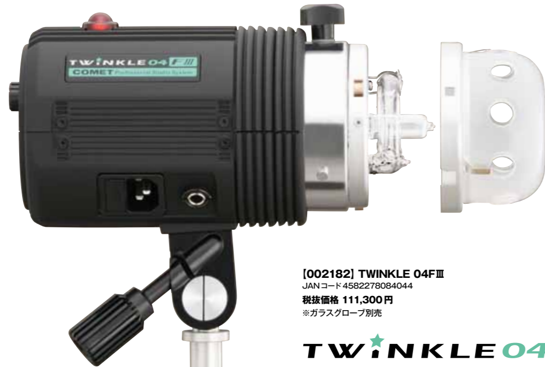
[002182] TWINKLE 04FIII JANコード 4582278084044 税抜価格 111,300円 ※ガラスグローブ別売