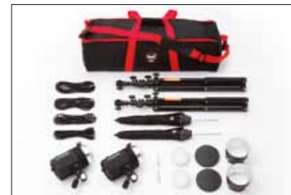
TWINKLE 02FIII アンブレラ2灯セット JANコード 4582278081487 税抜セット価格 274,400円