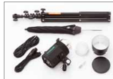
TWINKLE 02FIII アンブレラセット JANコード 4582278081470 税抜セット価格 130,900円