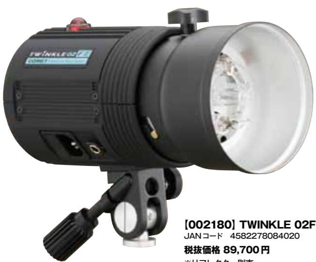
[002180] TWINKLE 02FIII JANコード 4582278084020 税抜価格 89,700円 ※リフレクター別売