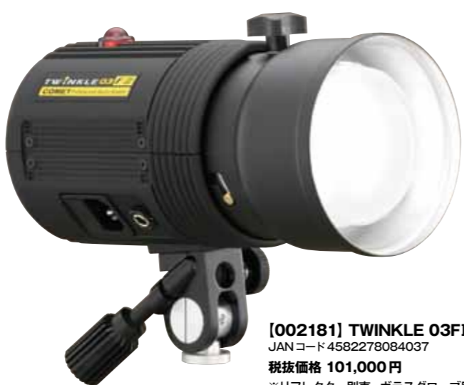
[002181] TWINKLE 03FIII JANコード 4582278084037 税抜価格 101,000円 ※リフレクター別売、ガラスグローブ別売