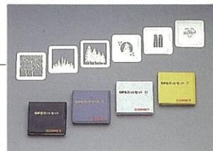
OPSカットセットI~IV(全85カット)好評発売中。

好評OPSカットセットが85カットに充実。豊富なカットパターンで個性的なバックをらくらく演出。ズーム機能を利用すれば投影されたイメージの構図・ぼけ味などを容易にコントロールできます。