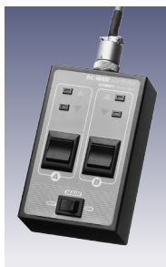
ワイヤードリモコン

高さや傾斜角度をリモコンでコントロールできる本格的なスカイライトです。本機はウェーハー100/140/200用の3機種があり、全機種にワイヤードとワイヤレスリモコンが付属します。