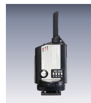
コメットRS- 発信器(別売) [232025]

コメットRS-発信器からストロボをシンクロ発光させることが出来るレシーバーです。