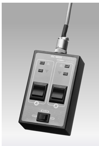
ワイヤードリモコン

スカイ枠電動昇降装置はウェーハーライトバンクと組み合わせカメラ位置からリモコンで、スカイライトの高さや傾斜角度の調整ができる装置です これにより思い通りのライティングが簡単に行えます