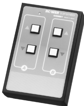
ワイヤレスリモコン

スカイ枠電動昇降装置はウェーハーライトバンクと組み合わせカメラ位置からリモコンで、スカイライトの高さや傾斜角度の調整ができる装置です これにより思い通りのライティングが簡単に行えます