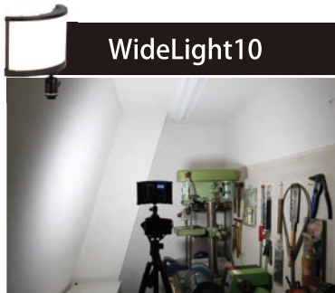
曲面による発光面は、限られた 空間により広い光を照射します。