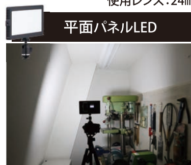
一般的な平面の発光面では WideLight10に比べて照射 範囲は狭くなります。