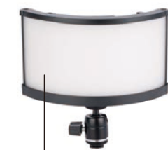
発光面は大きく湾曲し ワイドに照射

操作部 調光バリエーター Full (100%) ~ Minimum (10%) 色温度可変バリエーター 3200~5600Kまで可変 100Kステップでの調整が可能