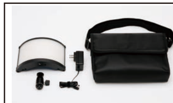
付属品 ACアダプター/自由雲台/収納ケース