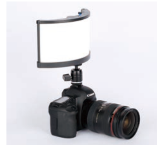
付属の自由雲台でカメラの アクセサリーシューに取付可能