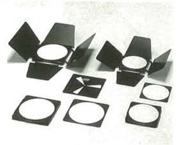
■ライトカッター ディフューザー枠 ライト調節板