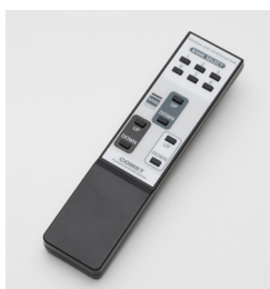
ワイヤレスリモコン

高さや傾斜角度をリモコンでコントロールで きる本格的なスカイライトです。本機はウェ ーハー100/140/200用の3機種があり、 全機種にワイヤードとワイヤレスリモコンが 付属します。