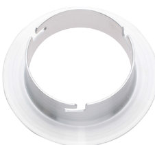
インサート金具 グラントBOXイルミ用CX [131024]