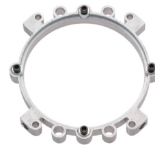
コメットスピードリング [131050]