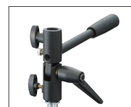
スタンドブラケット イルミネーター130用 [231438]

※別売のスタンドブラケット イルミネーター130用 [231438]との併用が必須となります。