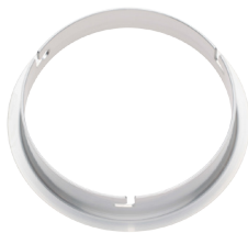
インサート金具ウェーハー SU [131017]

スピードリング(コメット)用/ウェーハー・キミール用 対応ヘッド：H-10ヘッド