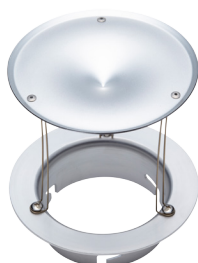
CX-バウンズプレート [121108]

インサート金具付き 対応バンク：パンケーキランタンS、M、L/スーパー プロシャローバンクS、M、L