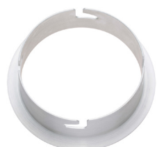
インサート金具ウェーハー RCT [131023]

スピードリング(コメット)用/ウェーハー・キミール用 対応ヘッド：H-10ヘッド