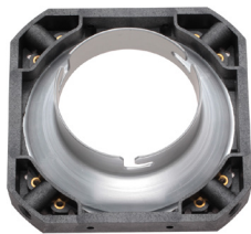
スピードリングパンケーキCX専用 [231368]

インサート金具付き 対応バンク：パンケーキランタンS、M、L/スーパー プロシャローバンクS、M、L