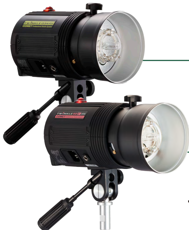
TWINKLE 034RS [002147]