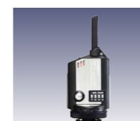
コメントRS-発信器 [232025] (別売)

コメントRS-発信器からストロボをシンクロ発光させることが出来るレシーバーです。