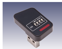
RSミニレシーバー [232029] (付属)