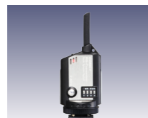
RS-発信器 [232025] (別売)

カメラに装着してシンクロ信号をRSミニレシーバーに送り、ストロボを発光させます。